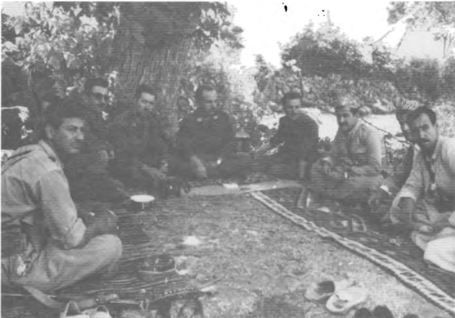
ته‌موزی ۱۹۶۴ - هه‌مه‌دان